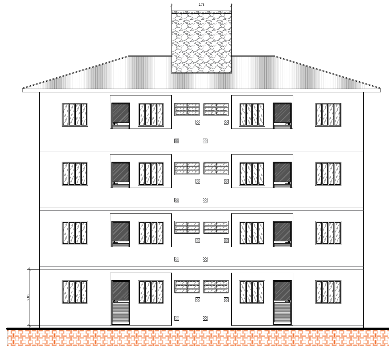
VISTA POR TRÁS ESCALA 1/100