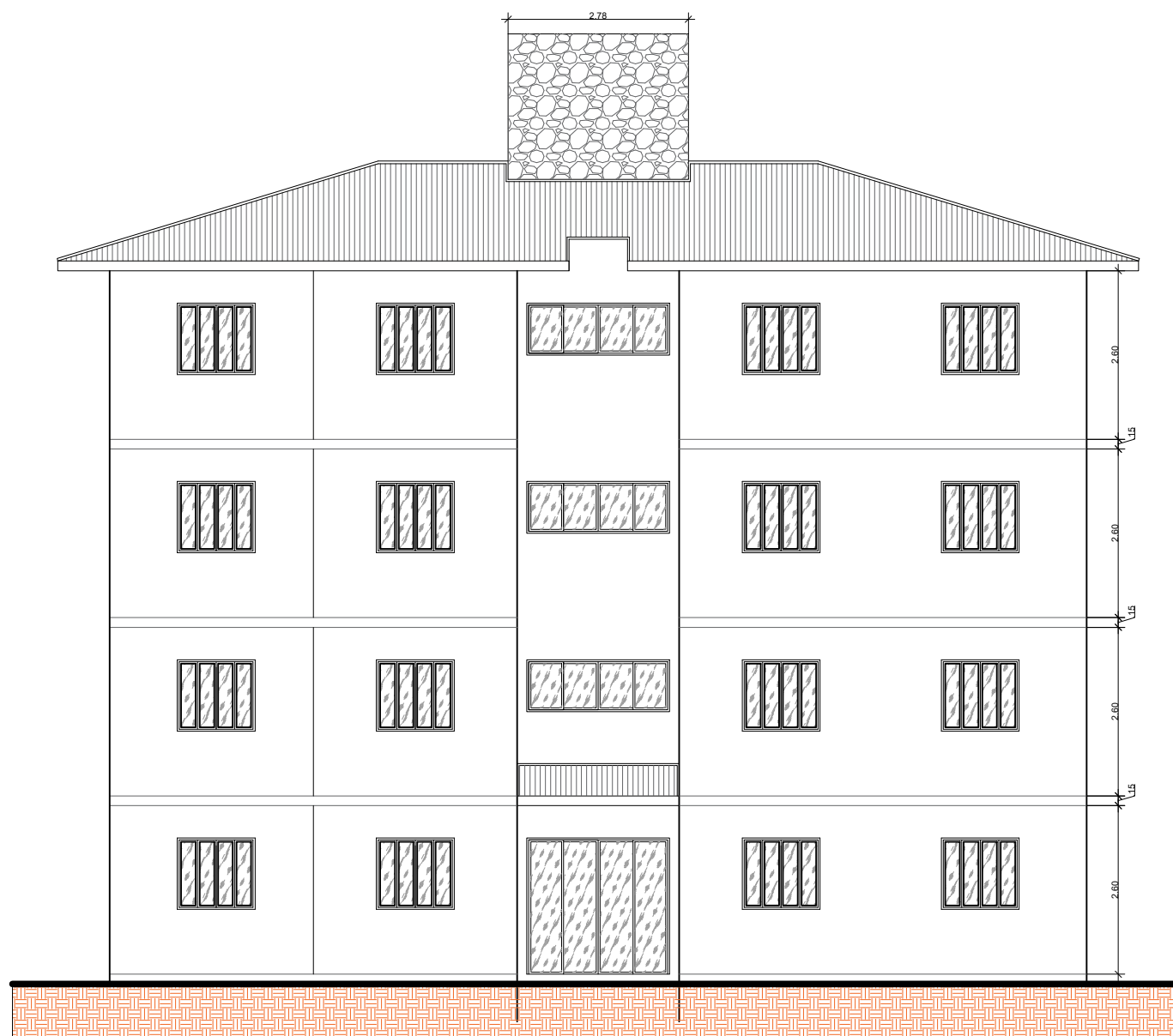
VISTA FRONTAL ESCALA 1/100