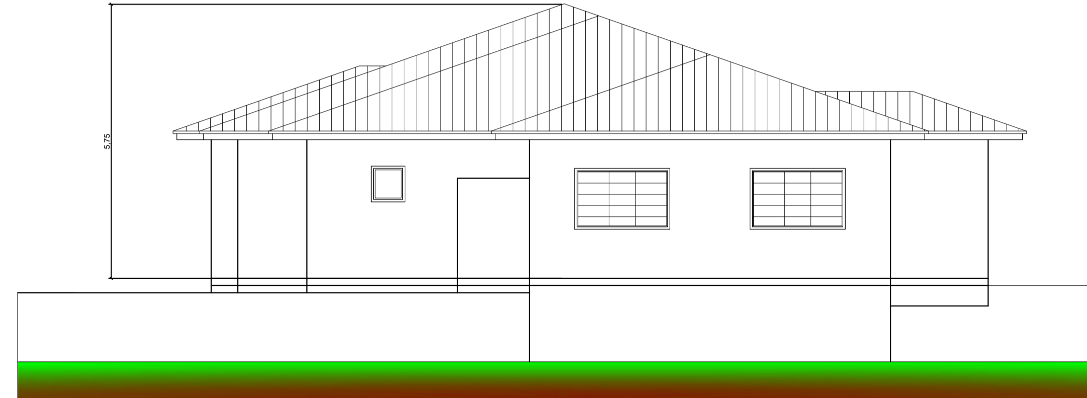
07 FACHADA OESTE