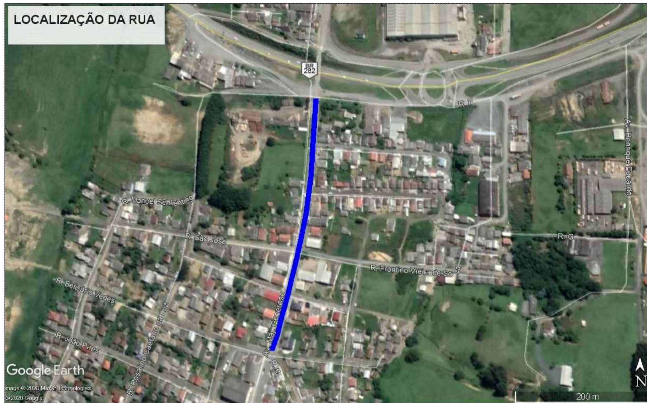
LOCALIZAÇÃO DA RUA MAJOR GENEROSO 227,00M