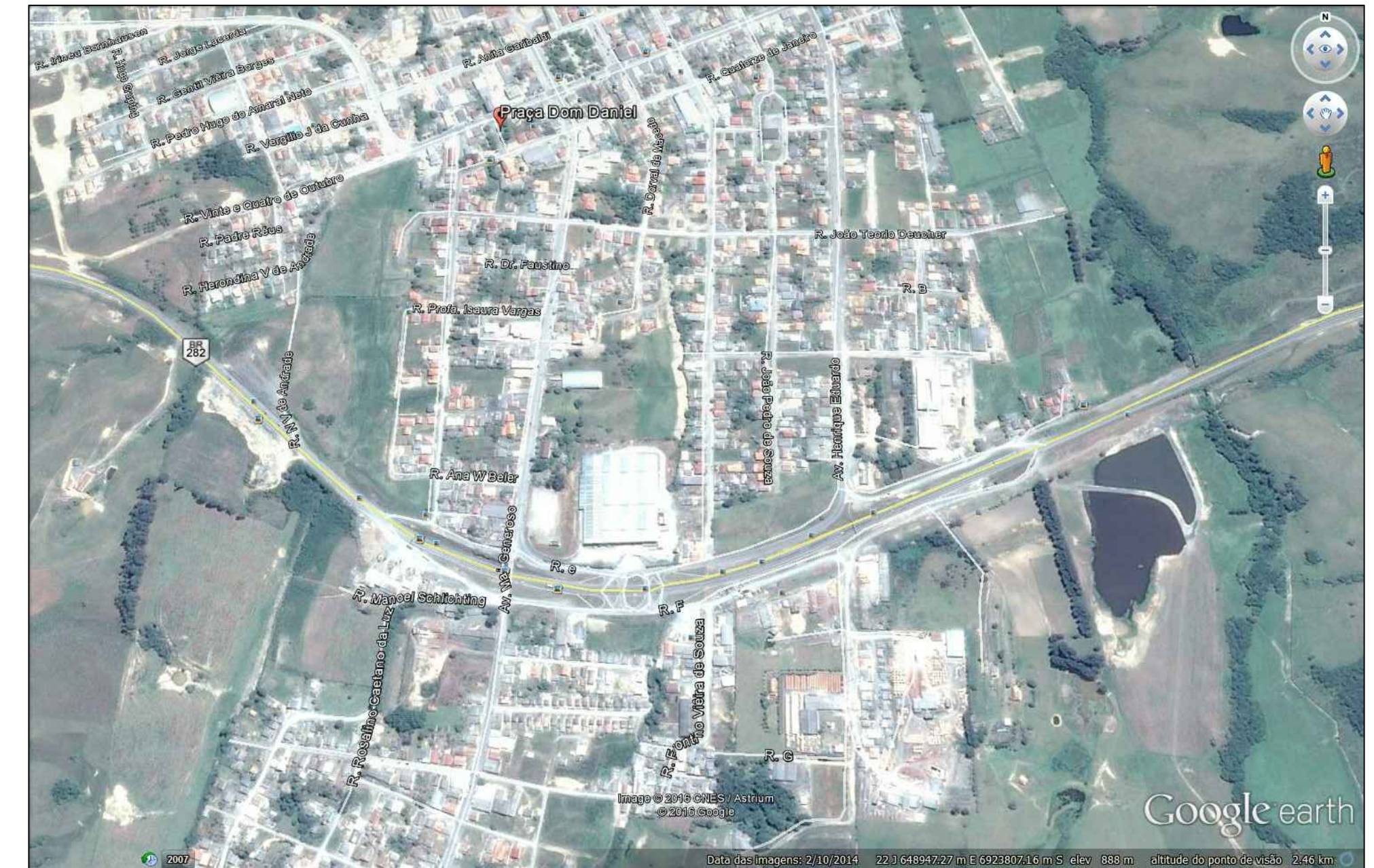
PLANTA DE LOCALIZAÇÃO Coordenadas U.T.M. da Área de Intervenção 22J 648947.27m E 6923807.16m S Sem Escala