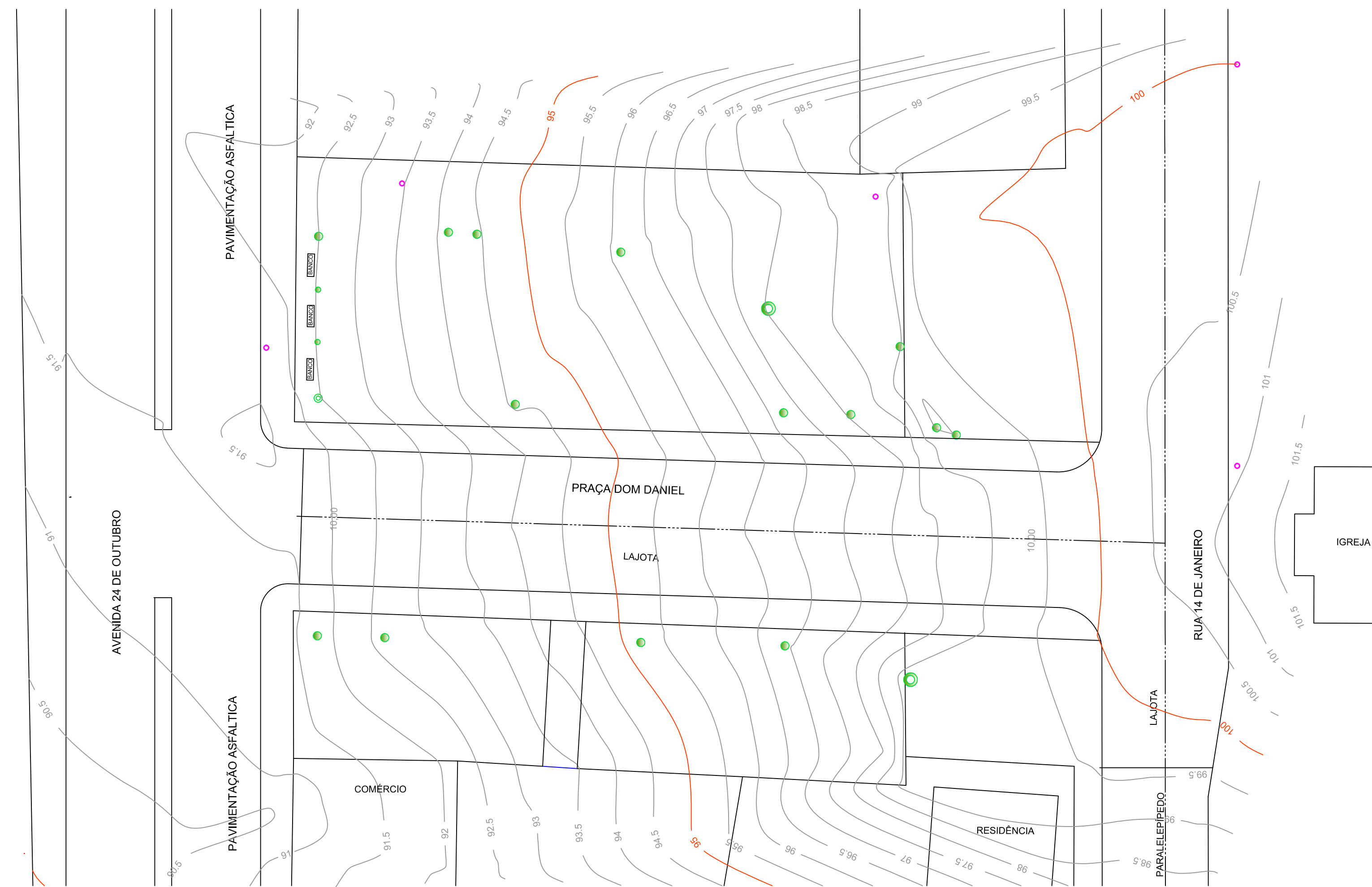
TOPOGRAFIA Escala 1/250